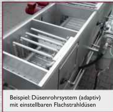
Beispiel: Düsenrohrsystem (adaptiv) mit einstellbaren Flachstrahldüsen