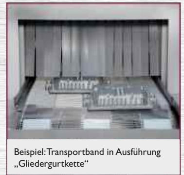
Beispiel: Transportband in Ausführung „Gliedergurtkette“