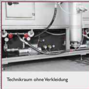
Technikraum ohne Verkleidung