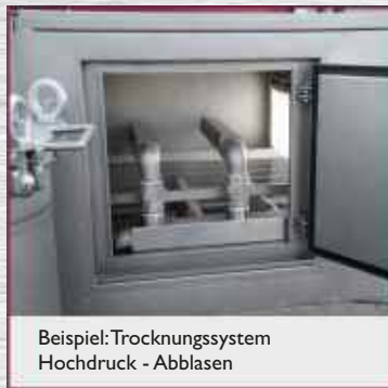
Beispiel: Trocknungssystem Hochdruck - Abblasen